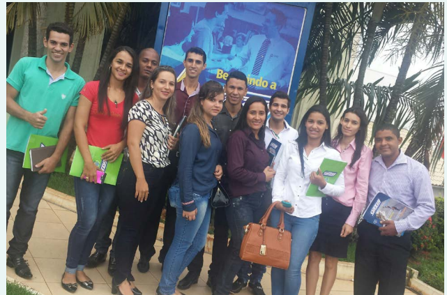
Vendedores e Caixas Rolim de Moura e Seringueiras